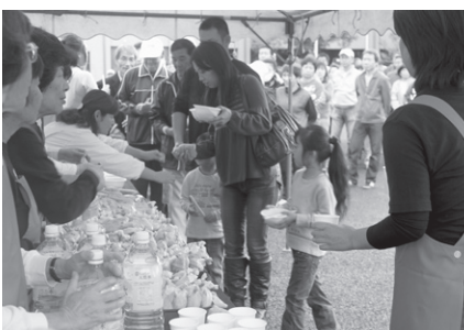
炊き出し訓練を行いました

三 若者定住促進対策 四 健康・福祉および子育て支 援の充実 五 環境保全型農業の推進とブ ランド化の促進 六 地籍調査事業の取り組み を位置づけました。