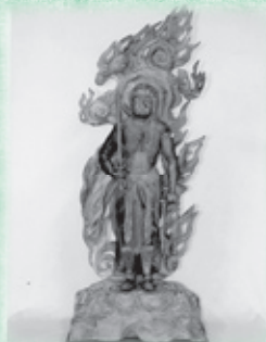
写真2 修理後の不動明王立像