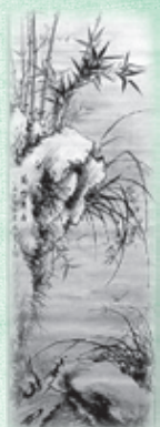
大多喜藩最後の藩主が描いた「蘭竹双清図」

写真の「蘭竹双清図」は、第9代大多喜藩主だった大河内正質が描いたもので、蘭と竹と双清(梅と水仙)が描かれています。正質は1844(弘化元年)年に生まれ、1862(文久2)年、大多喜藩松平家に婿養子になり家督を継ぎ、大多喜藩最後の藩主となりました。1867(慶応3)年12月、老中格となりましたが、翌年1月に鳥羽伏見の戦いで旧幕府軍を指揮して敗北し、改易され佐倉藩に預けられましたが、同年許され所領を回復。1869(明治2)年、版籍奉還により大多喜藩知事に就任しましたが、1871(明治4)年の廃藩置県により免官となりました。維新後は松平姓から大河内姓に復し、子爵に列せられました。