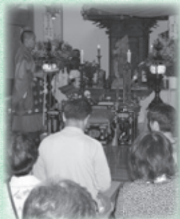
写真3 不動明王開眼法要

展」で公開される。平成21年9月27日に開眼法要が行われ(写真3)、千葉日報や、読売新聞など県内の各紙に掲載された。この仏像は像高62cm、台座から光背の先端までの総高は105cm。企画展「館蔵名品展」で公開される。