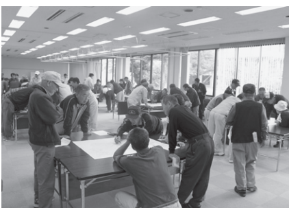
区ごとに危険箇所等を話し合いました