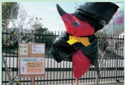
▲第3位「ハロウィン チーバくん」 (睦沢ふれあいスポーツクラブ 作)