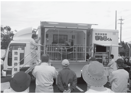
震度6弱の揺れを体感(地震体験車)