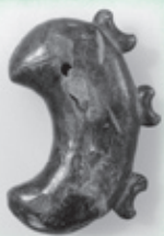
熊野神社裏遺跡出土子持勾玉

寺崎地区の熊野神社裏遺跡で出土した勾玉は、勾玉状の突起した子を背と胴に持つので子持勾玉と呼ばれます。装飾品として用いられた一般の勾玉とは異なり、子持勾玉は祭祀器具として用いられた特殊なもので、5世紀代に始まり7世紀代に作られなくなりました。写真の子持勾玉は大型で、全長8.5cm、厚さ2.1cmの滑石製です。5世紀末(古墳時代中期)のものと推定されます。この子持勾玉は学術的価値が高く、今年4月11日付けで町指定文化財に指定されました(種別は有形文化財・考古資料)。