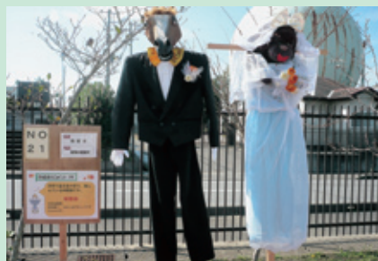
▲第2位「動物の結婚式」 (秋桜会 作)